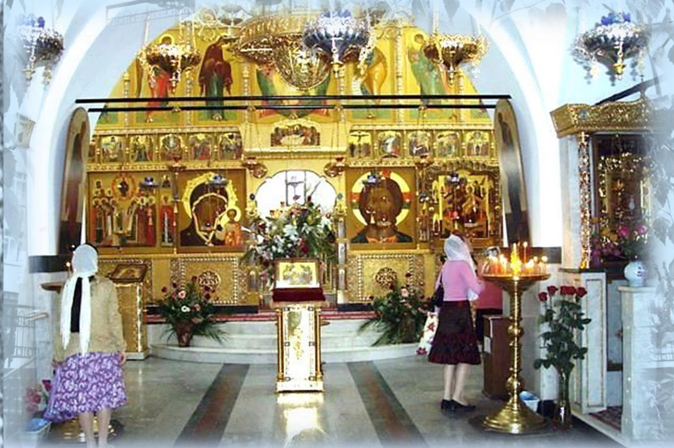
Интерьер верхнего храма «Всецарица»