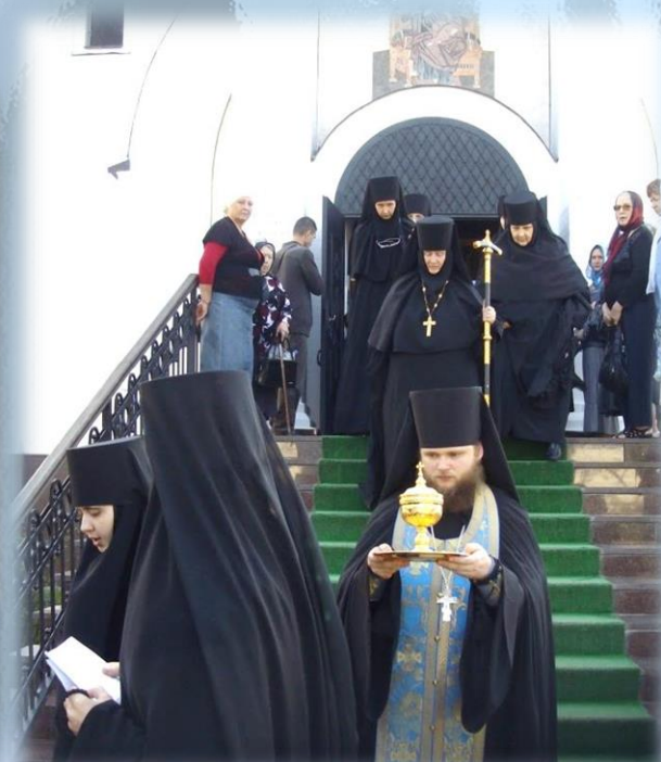
Чин о Панагии