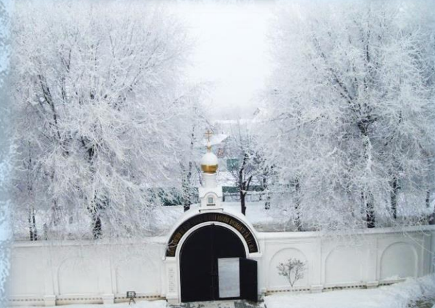
Зима. Монастырский дворик

Во время выполнения послушаний сестры читают Иисусову молитву. В 2010 г. налажен телемост между монастырями Краснодар – Екатеринбург, и насельницы обители еженедельно получают духовное окормление у духовника Александро-Невского Ново-Тихвинского женского монастыря схиархимандрита Авраама.