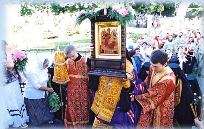
Крестный ход, доставка иконы «Всецарица» в монастырь

Доставлена икона «Всецарица» из Греции в Москву афонскими монахами, а из Троице-Сергиевой Лавры в г. Краснодар – монахами Лавры, торжественно встречена на железнодорожном вокзале Краснодар-1 и Крестным ходом доставлена в обитель. В 2006 г. икона помещена в построенный для нее мраморный кювет с сенью и колоннами из меди с позолотой, украшенными эмалью.