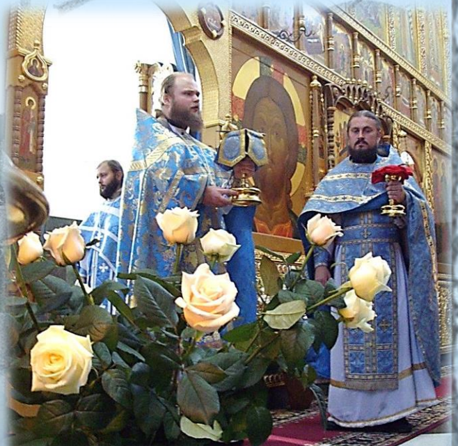
Таинство Причащения Святы́х Христовых Тинн