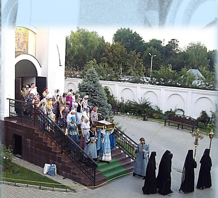
Крестный ход на Успение Пресвятой Богородицы

В штате монастыря состоят 4 священника и диакон. Ежедневно служит Божественная литургия и Вечернее Богослужение. На Богослужениях звучит византийское пение, которому сестры учились в Ново-Тихвинском монастыре. После вечерней службы ежедневно совершается Крестный ход вокруг обители с иконой «Всецарица». Сестринская Полунощница с Пятисотницей служит в полночь, как на Афоне. Круглосуточно читается Неусыпаемая Псалтирь силами сестер и постоянных прихожан. 5 раз в неделю служит молебен с акафистом пред Чудотворной иконой Божией Матери «Всецарица», на котором молятся болящие из онкологического диспансера и других рядом расположенных больниц.