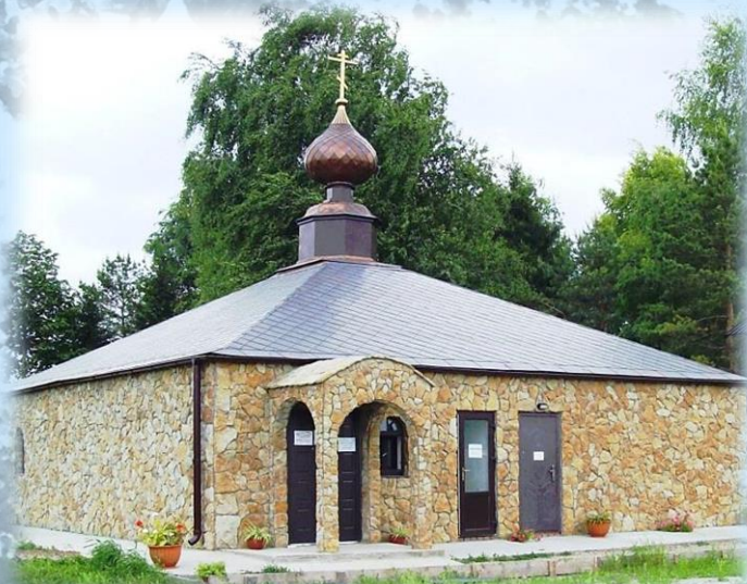
Пещерный храм прп. Саввы Освященного

В качестве образца архитектором был взят Софийский собор в Константинополе, он уменьшен в 4 раза; строительство началось весной 2012 г. за пожертвования благодарных богомольцев к Чудотворной иконе Божией Матери «Всецарица». В 2013 г. возведена часовня свт. Николая Чудотворца с медным куполом и корсунским Крестом.