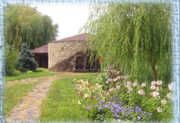
Купель святого источника