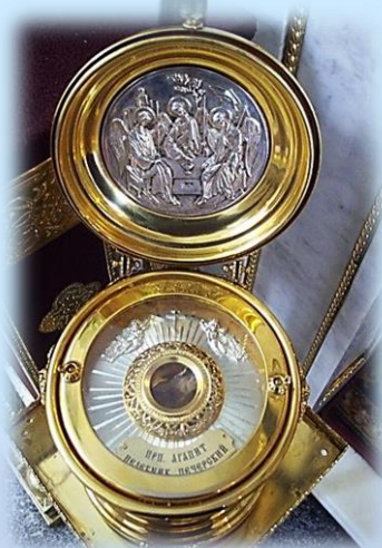
Частица мощей прп. Агапита Печерского

В течение 2005-2013 гг. в монастыре собраны следующие святыни: Чудотворный образ Божией Матери «Всецарица» - выполнен в мае 2005 г. иконописцем Поляковым В.Н. список с древнего оригинала в Ватопедском монастыре на Афоне (Греция) и приложен к 130 святыням монастыря Ватопед, в т.ч. к Поясу Пресвятой Богородицы; ковчег-мощевик с частицами мощей 33 святых угодников Божиих (эти святые жили и подвизались в разных странах в разное время: от великомучеников Георгия Победоносца и Пантелеимона Целителя, которые пострадали в Римской империи в самом начале IV в., до блж. Матроны Московской, русской подвижницы XX в.); частицы мощей прп. Агапита целевника Печерского и прп. Саввы Освященного; иконы с частицами мощей – Святейш. Патриарха Московского и всея Руси Тихона, вмч. Феодора Тирона, свт. Дмитрия Ростовского;