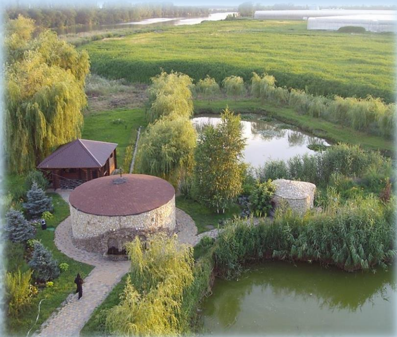
Вид на купель, святой источник и монастырскую лавку