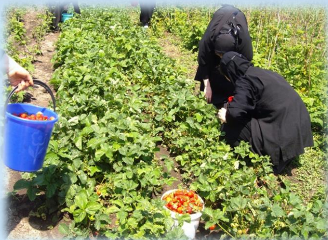
Бестры на послушании – уборка клубники на подворье

Начиная с 2006 г., монастырь посещают паломнические группы из разных регионов России, Ближнего и Дальнего Зарубежья, а также кубанские школьники и студенты, воспитанники детских домов и интернатов.