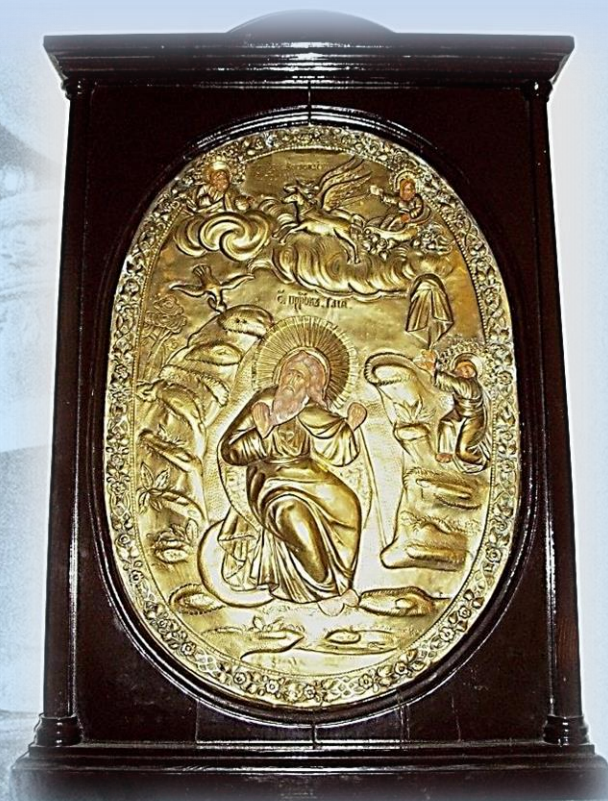
Икона Илии Пророка