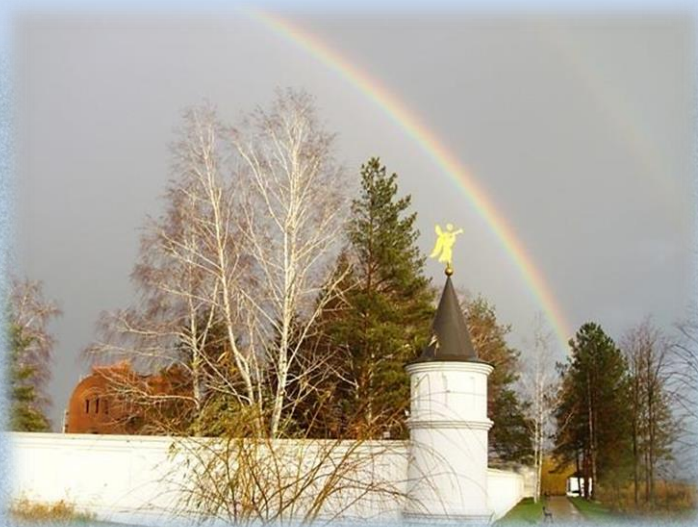
Радуга над строящимся храмом Благовещения

С 2007 г. монастырь имеет свой сайт, в котором помещаются новости Православия и монастырской жизни. Фильмы о создании и жизни монастыря: «Небо на Земле» (снят в 2009-2010 гг.) и «Золотое сечение России» (2012 г.).