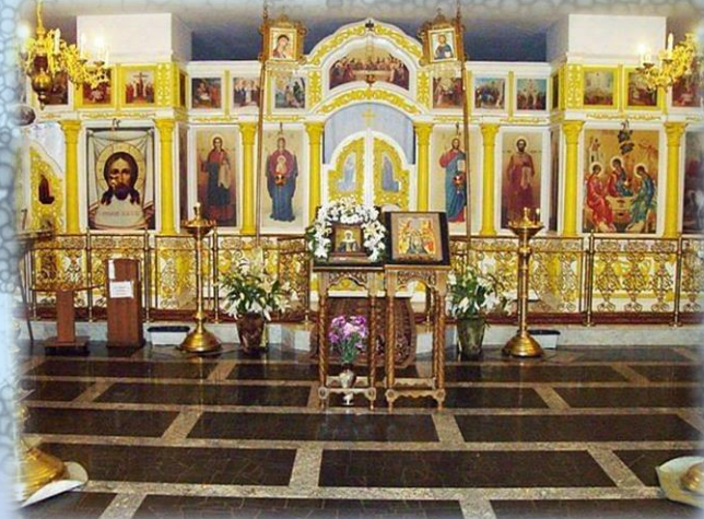
Нижний храм в честь св. равноап. Пины