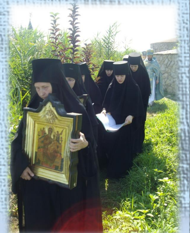
Крестный ход на подворье к источнику