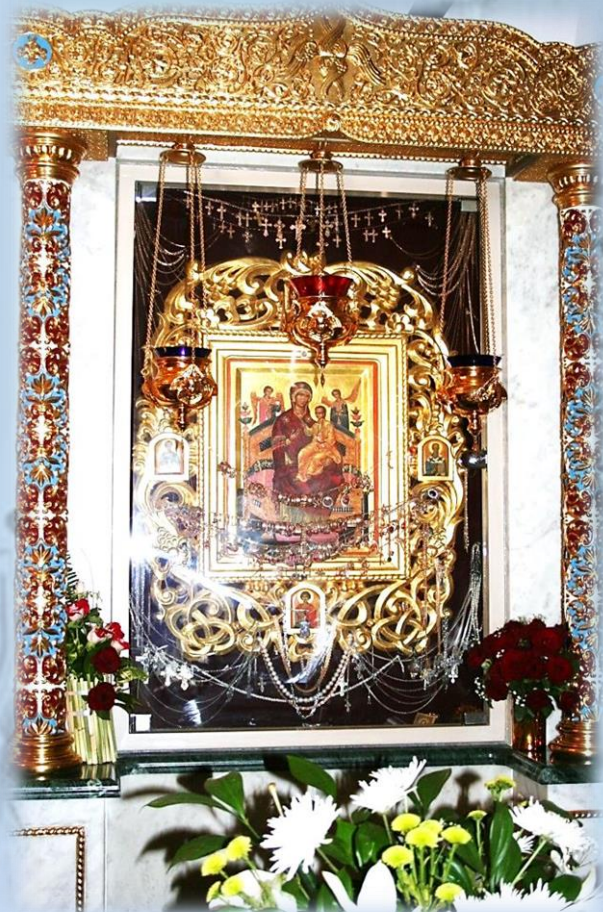
Икона «Всецарица» в мраморном кювете

На территории монастыря в г. Краснодаре справа от алтарной части храма «Всецарица» расположена часовня в честь св. апостола Иоанна Богослова, украшенная флорентийскими мозаичными иконами 4-х апостолов-евангелистов, с золоченым куполом и византийским Крестом.