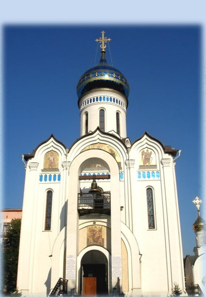
Храм в честь иконы Божией Матери «Всецарица»

Подворье. Вид из Гефсиманского сада на Благовещенский храм и часовню свт. Николая Чудотворца