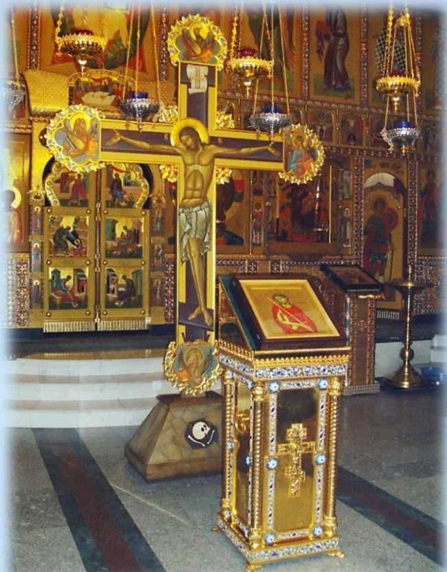
В Великий пост. Распятие Господа Иисуса Христа