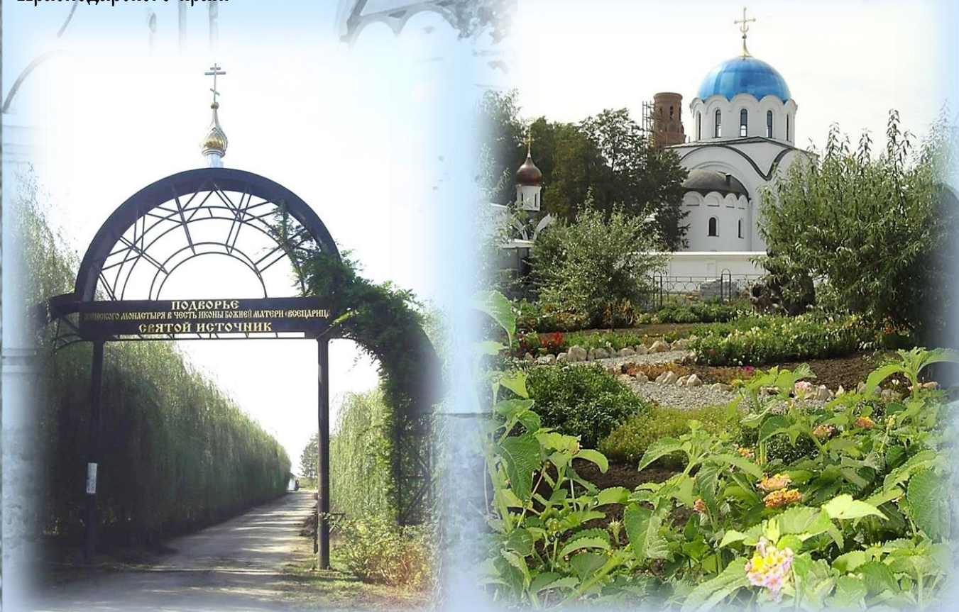
Входная арка на подворье монастыря

Подворье монастыря площадью около 7 га находится в Динском районе Краснодарского края, северо-западнее станицы Пластунской, на берегу реки Ставок и существует с 2005 г. Земля для подворья была выделена администрацией Краснодарского края.