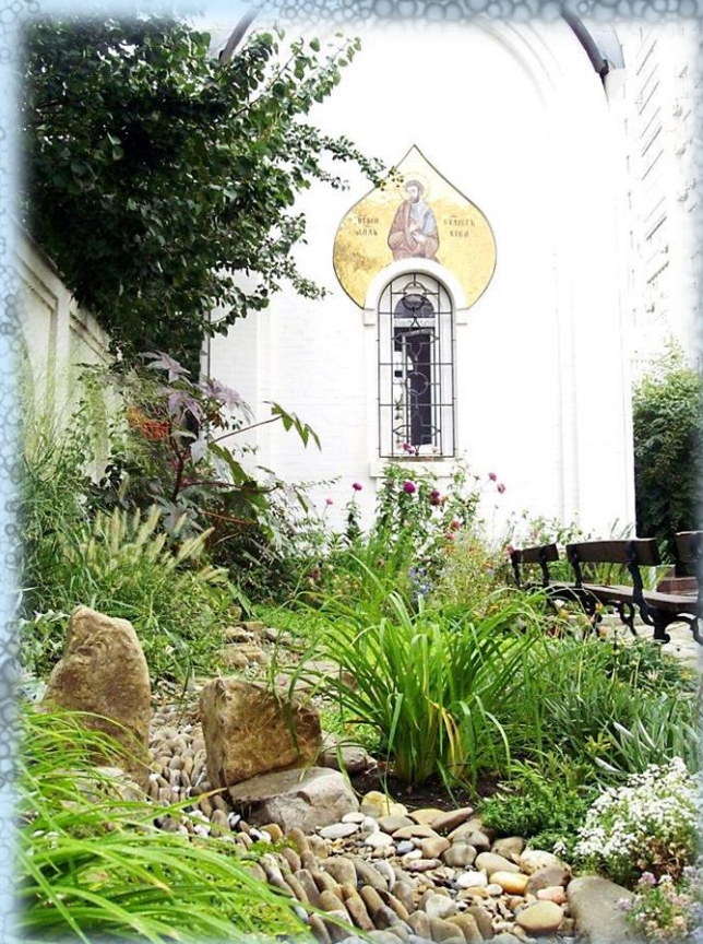
Вид с севера на часовню Иоанна Богослова