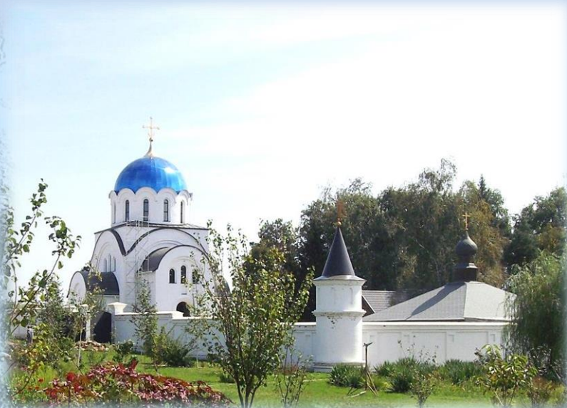
Подворье. Благовещенский храм и храм прп. Саввы Освященного