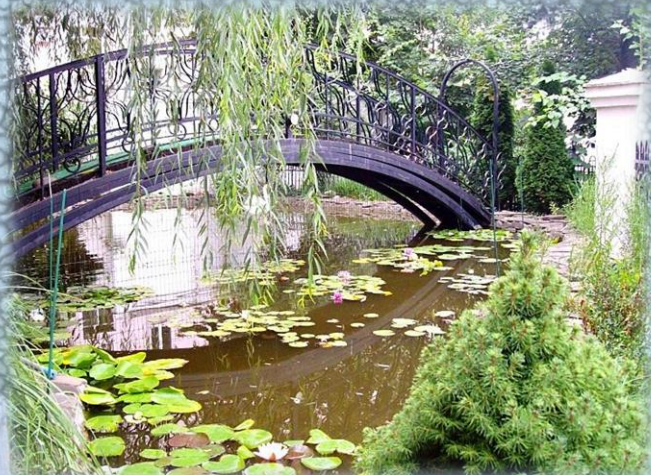
Виды монастырского дворика