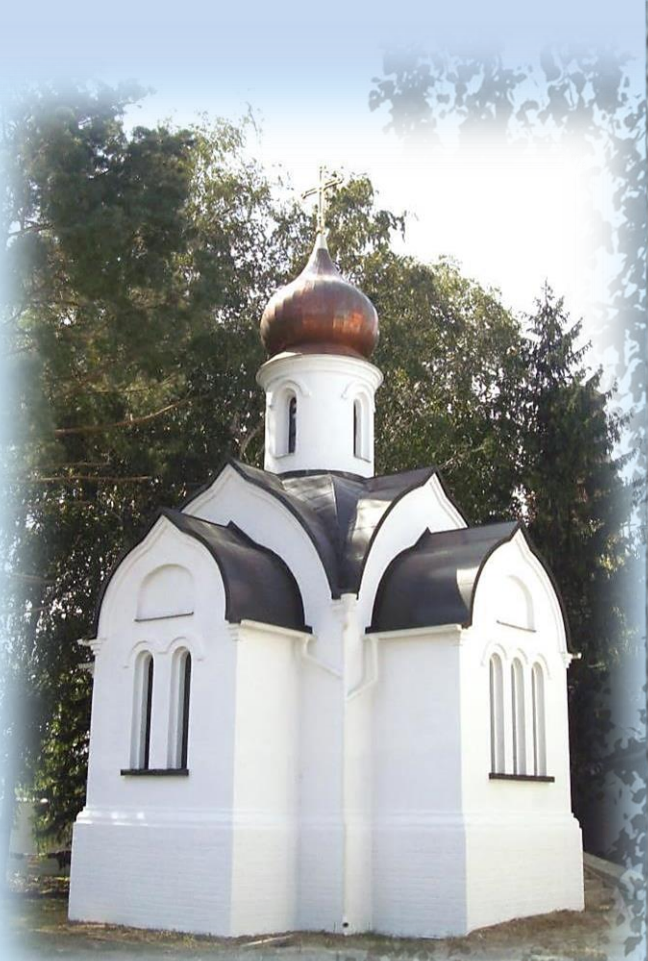
Часовня свт. Николая Чудотворца

Рядом с архитектурным комплексом подворья впервые в России, с благословения митрополита Екатеринодарского и Кубанского Исидора, создается аналог Гефсиманского сада. Конфигурация и размеры сада, его куртин и дорожек, окаймление дорожек камнем-известняком, расположение деревьев, колодца и скамеек в точности повторяют Гефсиманский сад в Иерусалиме, как он выглядит в настоящее время. При оформлении сада цветочно-декоративными растениями использованы те же растения, что в Гефсиманском саду – иссоп, лаванда, герань, алиссум, лобелии, колеус, портулак, антирриниум, агератум, циннии, сальвии, ирисы, розы и др. Ограда сада изготовлена аналогично ограде современного Гефсиманского сада в Иерусалиме, какой она является с восточной стороны. В настоящее время ведутся работы художником по камню и скульптором (строительство пещеры, стены с барельефами «Моление о чаше» и «Арест Спасителя»).