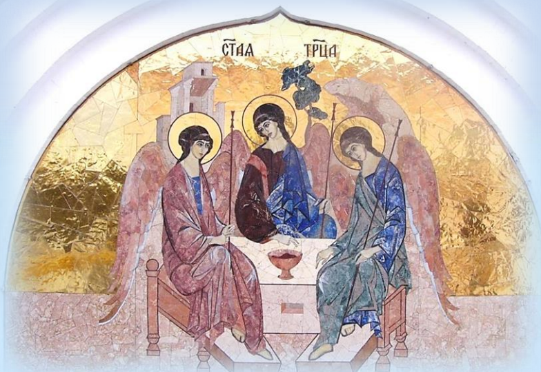
Икона «Святая Троица» (флорентийская мозаика)

В часовне устроена купель для крещения взрослых с полным погружением; в праздник ап.Иоанна Богослова в часовне служитя водосвятный молебен; в ней же миряне читают Неусыпаемую Псалтирь. На северо-запад от храма расположен административно-келейный корпус с узкими окнами в старинном стиле, монастырская лавка и помещение охраны.