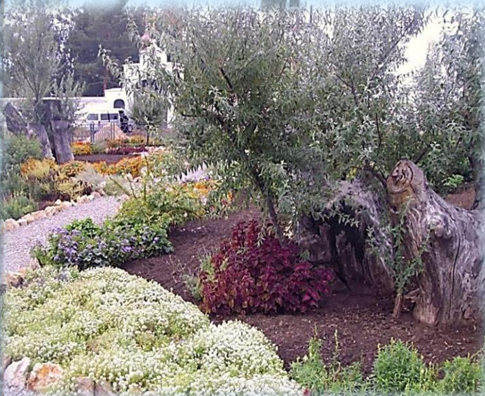
Аналог Гефсиманского сада на Кубани