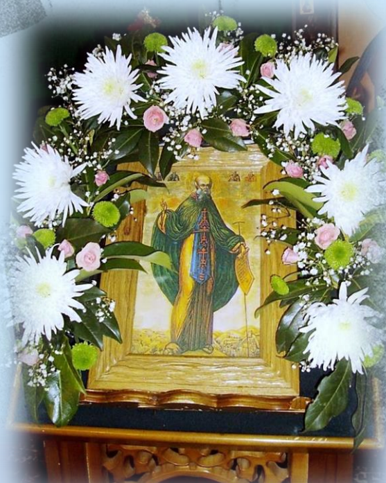
Икона прп. Саввы Освященного