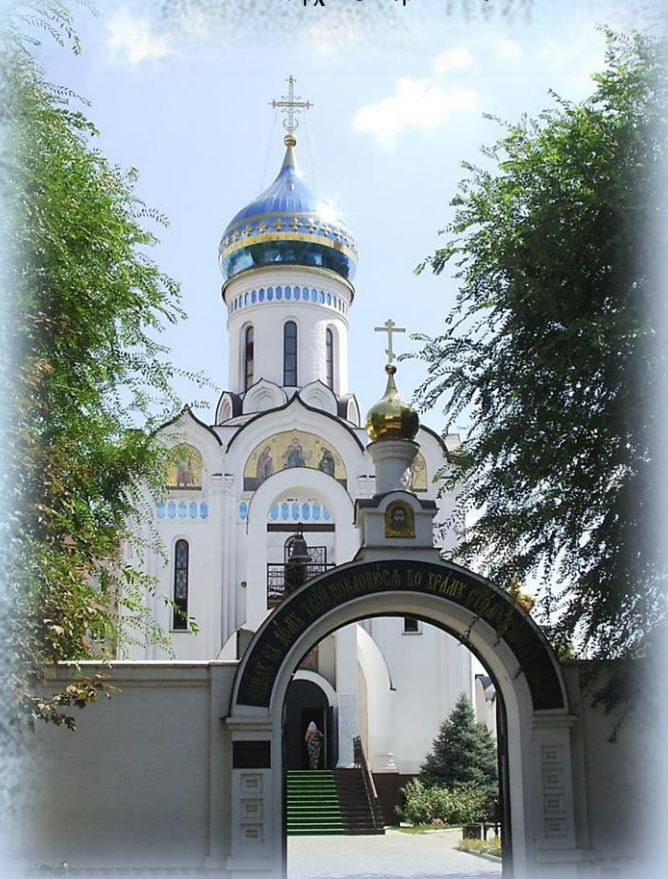
Вход с ул. Димитрова в женский монастырь «Всецарица»