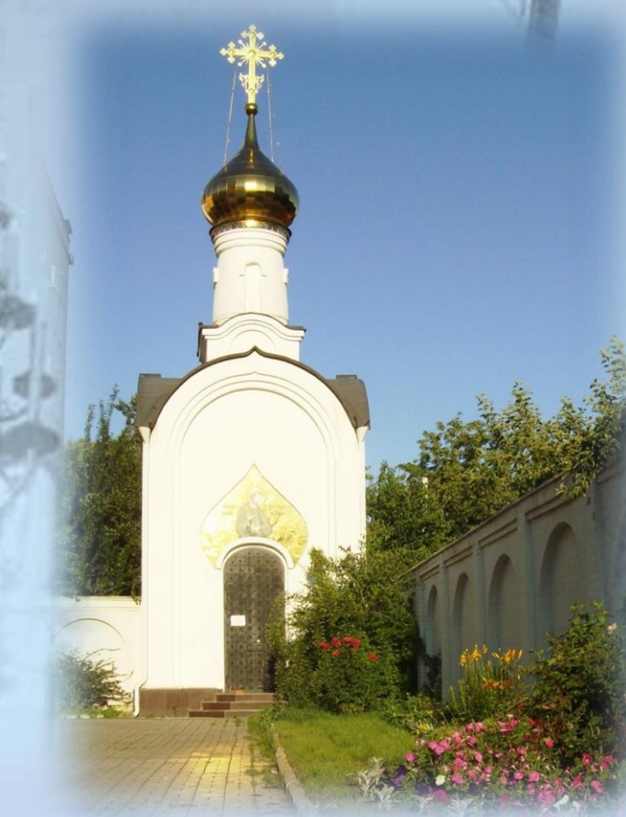
Часовня в честь св. апостола Иоанна Богослова