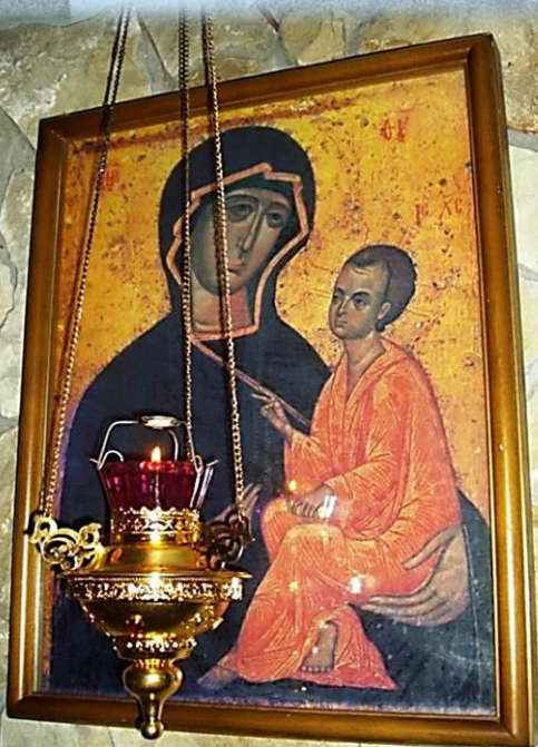
Икона Божией Матери «Тихвинская»