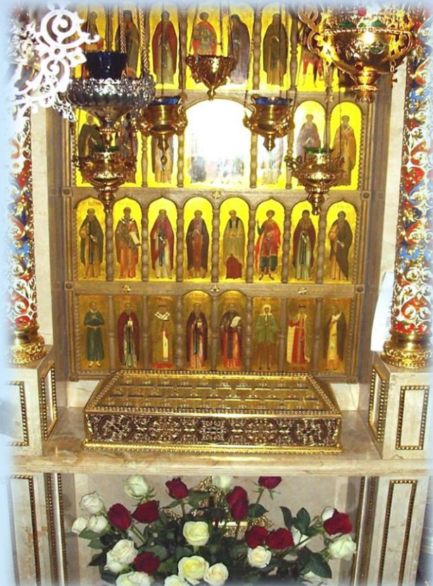
Мощевик с иконами святых