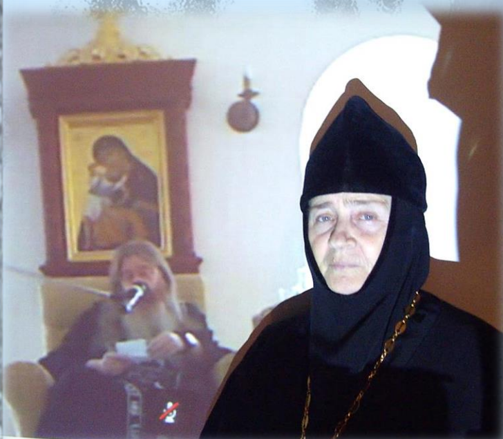
Телемост с духовником схиархимандритом Авраамом

В настоящее время (2013 г.) в монастыре 3 монахини, 7 инокинь и 4 послушницы. Сестры выполняют следующие послушания: на клиросе, на колокольне, в просфорне, на кухне и в трапезной, в ризнице, в пошивочной и иконописной мастерских, в монастырской библиотеке (в ней собрано более 2000 книг), поддерживают чистоту и порядок в храме, в часовне и в сестринском корпусе, стирают и утюжат белье, принимают участие в создании и поддержании монастырского сайта, читают Неусыпаемую Псалтирь, трудятся на монастырском подворье (в храме, на святом источнике, на цветниках, на кухне). Самое главное ежедневное послушание сестер – молитвенное, которое выполняется и в храме, и келейно, включает дневные и ночные молитвы.