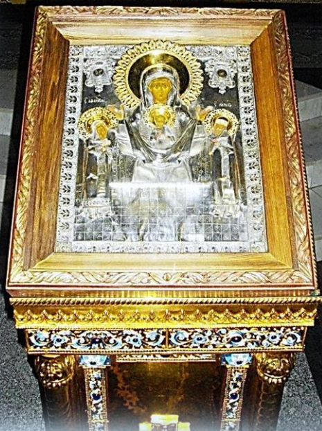
Икона Божией Матери «Знаменье»