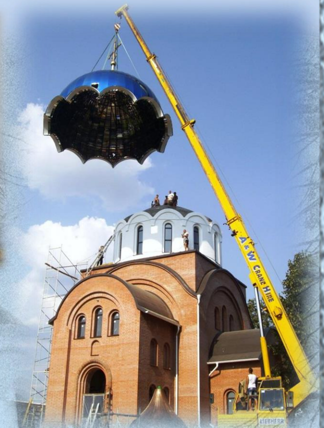
Установка купола на Благовещенский храм, июль 2013

С 2007 г. монастырь имеет свой сайт, в котором помещаются новости Православия и монастырской жизни. Фильмы о создании и жизни монастыря: «Небо на Земле» (снят в 2009-2010 гг.) и «Золотое сечение России» (2012 г.).