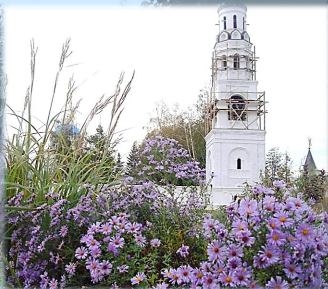
Строительство часовни-колокольни влч. Георгия Победоносца