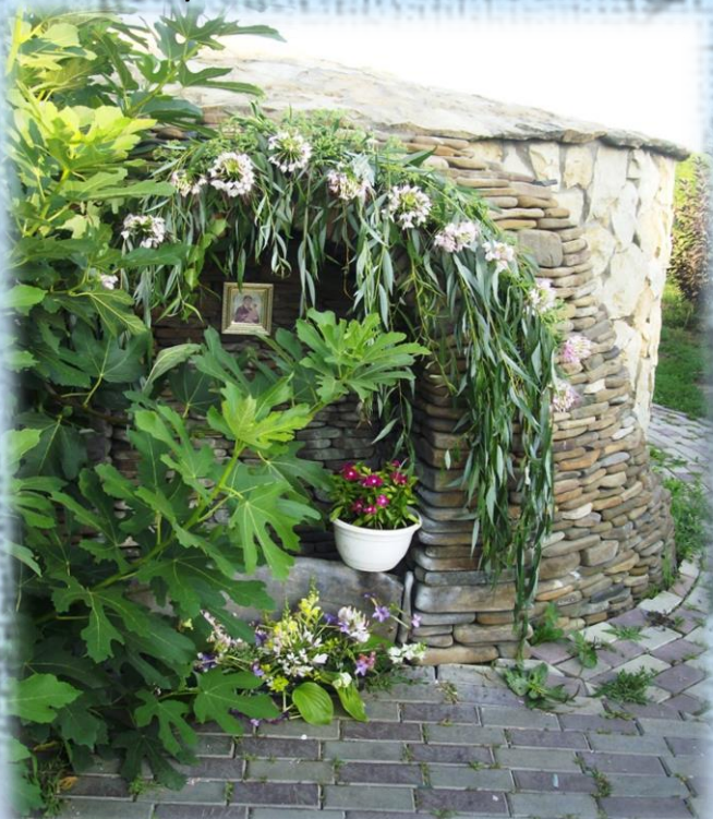
Святой источник иконы Божией Матери «Тихвинская»