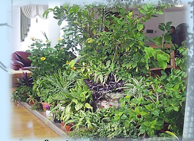
Зимний сад в сестринском корпусе