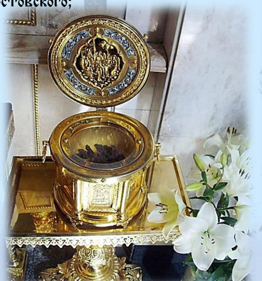
Ковчег с частицей коры Мамврийского дуба